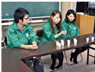
エコ活動について語る平野代表 (中央)

一人一人に関わることで、大切なのは、環境に関心を持つこと。そして、どんなに小さなことでも、まずは自分でできる活動から始めることが、エコの第一歩なのだと感じました。