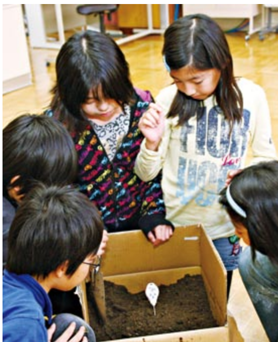
温度を測って土をまぜる作業を毎日繰り返します

取材に向かったのは百合が原小学校。積極的にエコ活動を行っている学校です。その中で体験させてもらったのは「生ごみの堆肥化」。百合が原小学校では、環境委員の児童たちが、給食で残った生ごみを肥料にする取り組みを行っています。発酵させた土に生ごみをいれ、毎日かきまぜると3カ月ほどで肥料になり、校内菜園などに使用します。印象的だったのは、児童たちが笑顔で楽しそう