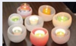
完成したキャンドル