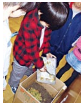
ダンボールに入った土に残った給食を入れます

取材を通して学んだことは、エコ活動に大切なのは意識の持ち方ということです。ごみ分別や節水・節電といった身近なことも立派なエコ活動。難しいことではありません。みなさんも、生活の中からエコ活動を見つけてみませんか。